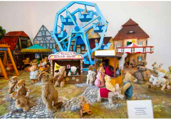
Mit viel Liebe zum Detail sind im Museum besondere Tage aus einem Bärenleben nachgestellt.